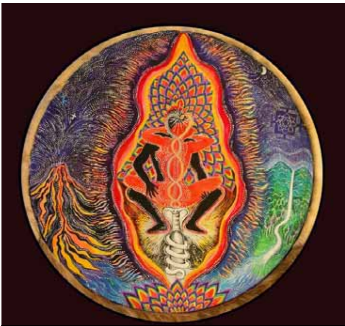
Dibujo de Mukee Okan. www.spiritfireproductions.com

Los orgasmos de la mujer son expresiones de placer y éxtasis, somos los primeros en promocionar y propagar que la mujer tenga orgasmos y múltiples orgasmos por que es lo mejor que le pueda pasar para su salud emocional, mental, física y espiritual. Todas las mujeres son capaces de tener orgasmos,