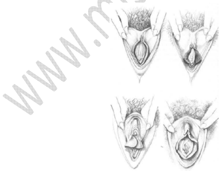
From the book "Sex for One: The Joy of Selfloving" by Betty Dodson. Copyright 1987, 1983, 1974 By Betty Dodson.

Los labios menores tienen muchas terminaciones nerviosas, su sensibilidad a la estimulación varía considerablemente entre las mujeres. Algunas mujeres son totalmente insensibles a la estimulación de estos labios mientras que otras encuentran la estimulación de estos labios muy placentera.